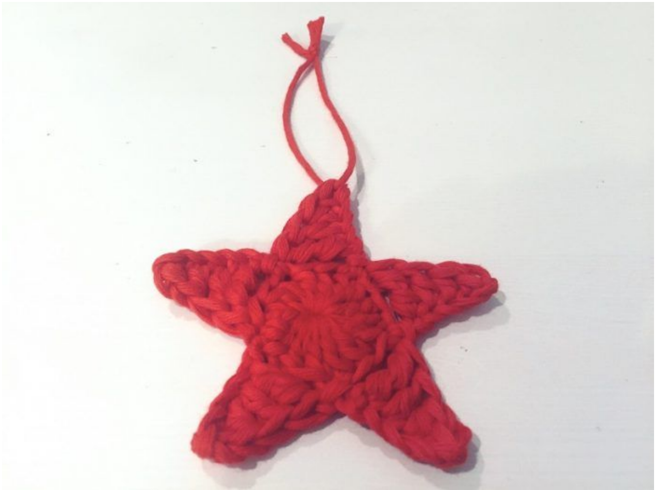
Estrella de Navidad.