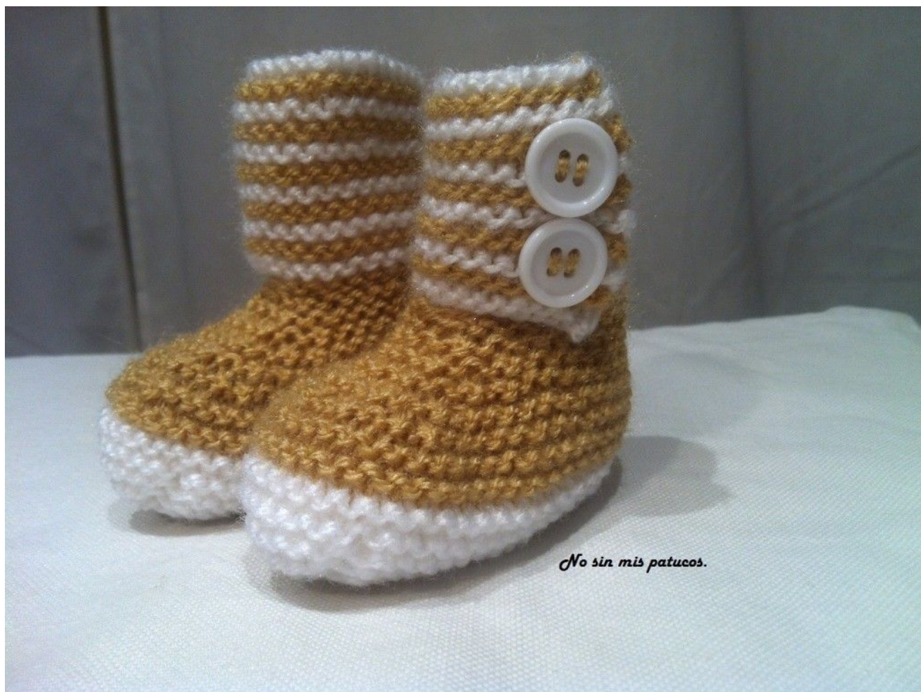
Patuco bota con dos botones.