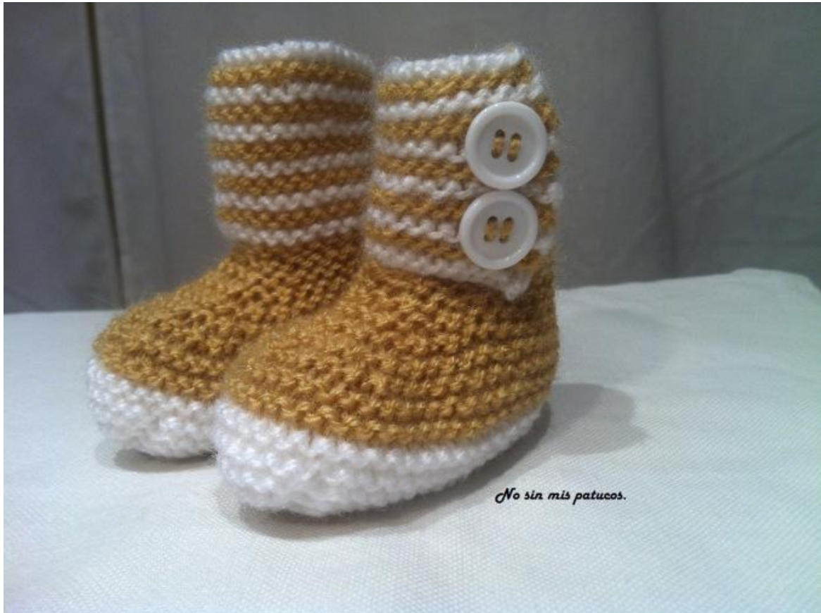
Patuco bota con dos botones.