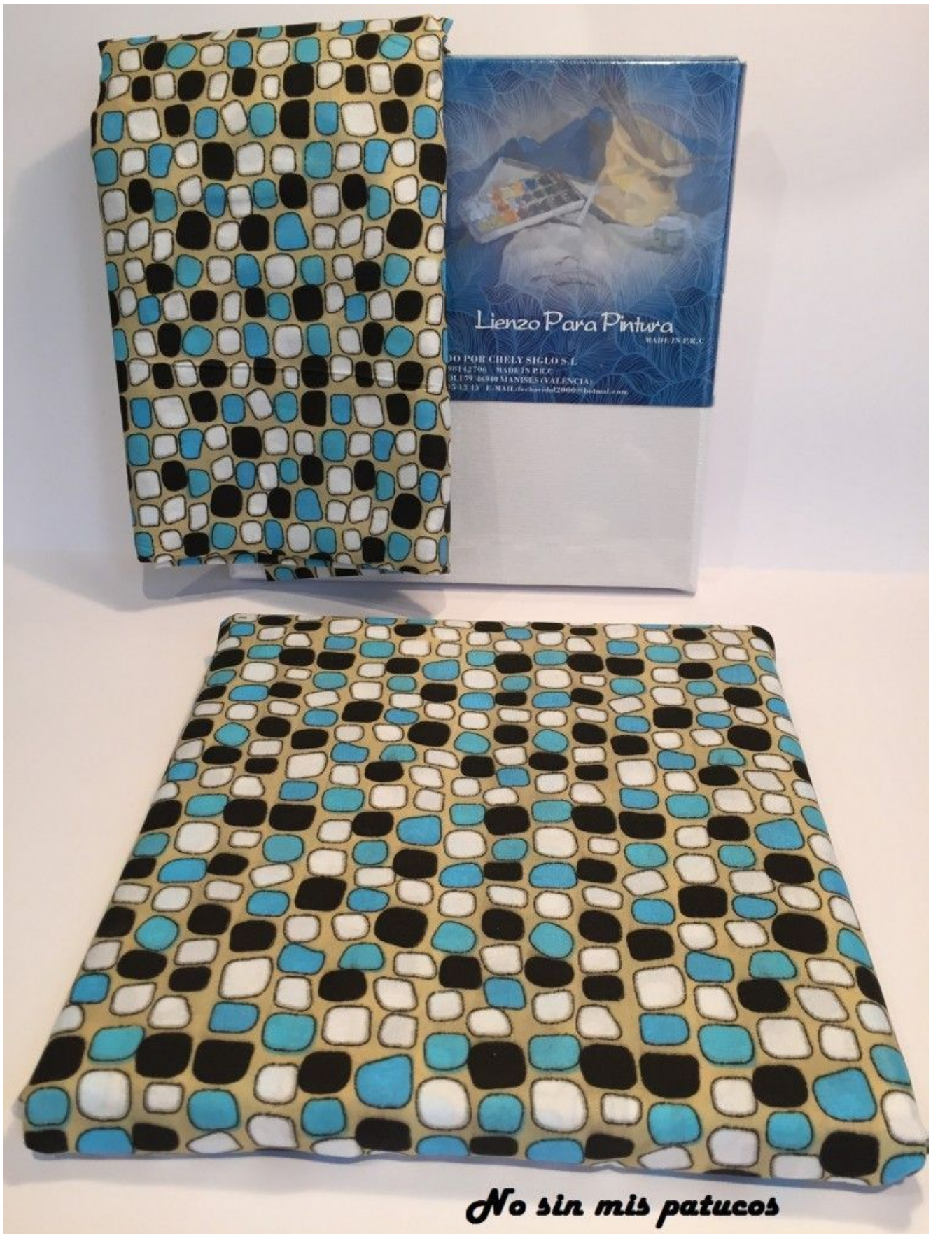
Forramos los lienzos con la tela.