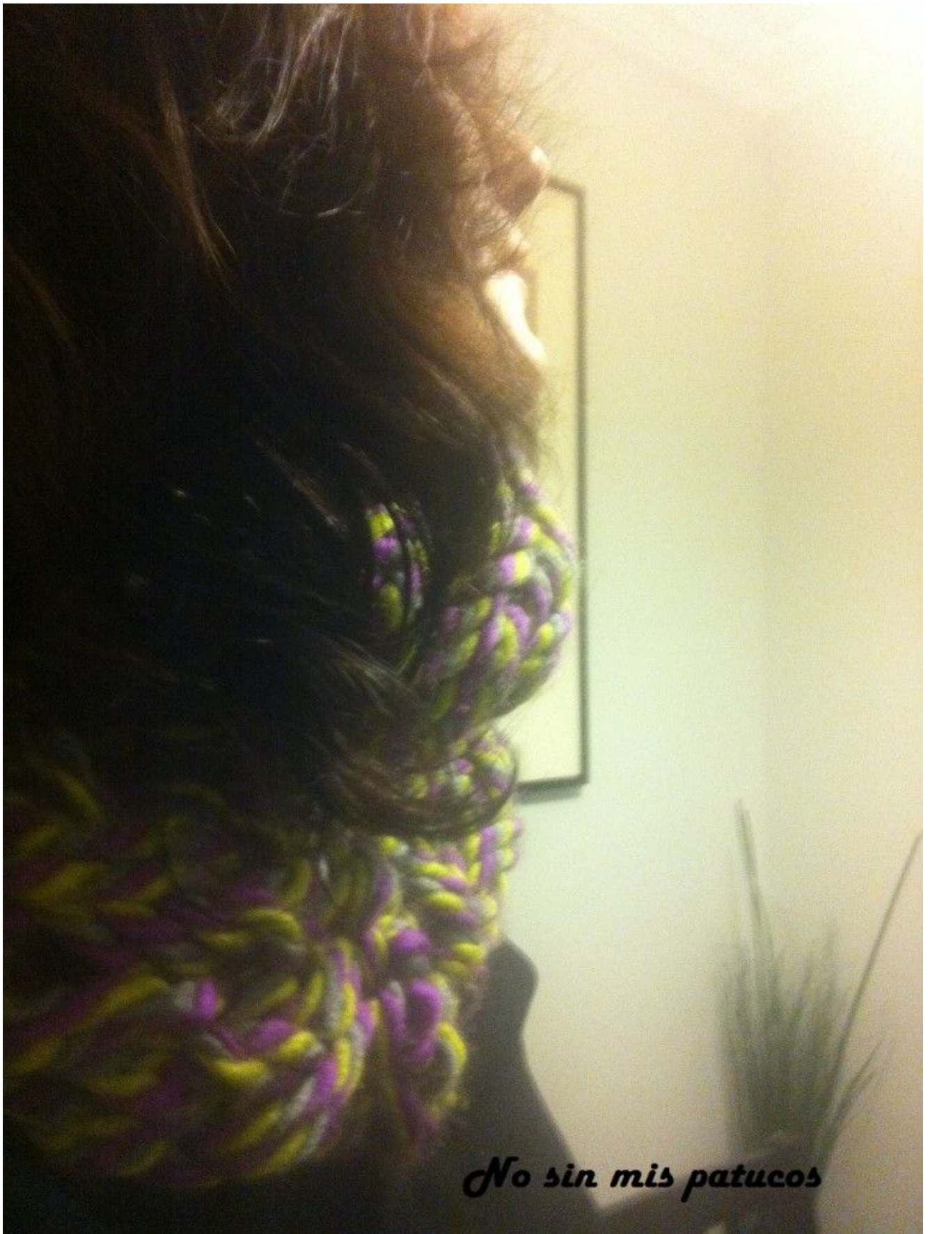
Bufanda tejida con las manos.